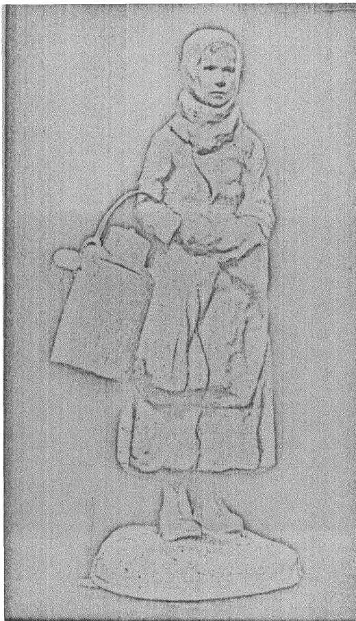
MJÖLKSURRAN av RUTH MILLIS