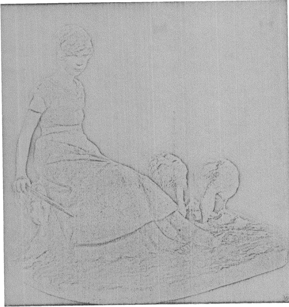
GÅSLISA av RUTH MILLES.

tillämpningen av dessa. Så som lagens ordalydelse är, tillämpas den även — utan avseende till de förändringar, som den allmänna moraliska rättsuppfattningen genomgått.