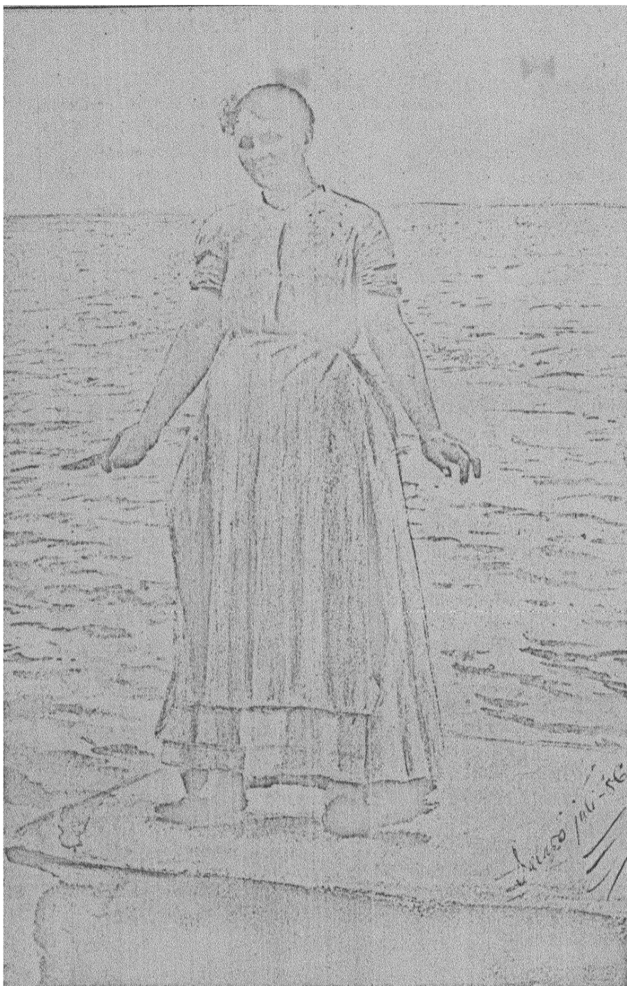
»VÅGSKVALP» AF ANDERS ZORN.