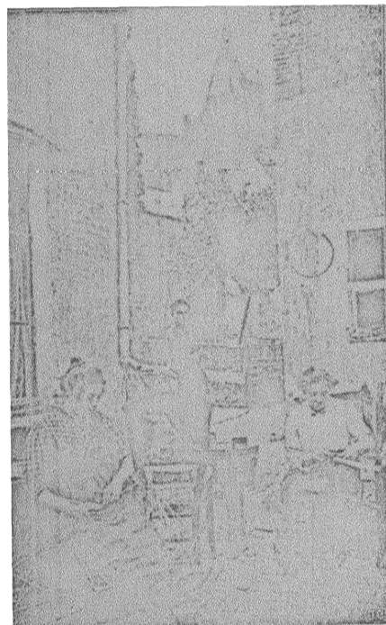
FLÄTNING AV STOLSITSAR.

Inom handsktillverkningen är det "nödvändigheten att klippa varje par på sitt särskilda sätt allt efter skinnets beskaffenhet, dess storlek och utscende samt nödvändigheten att draga fördel härav genom att kombinera det med andra, som", säger Beatse, "utgör ett oöverstigligt hinder för handarbetets utbytande mot maskinarbete."