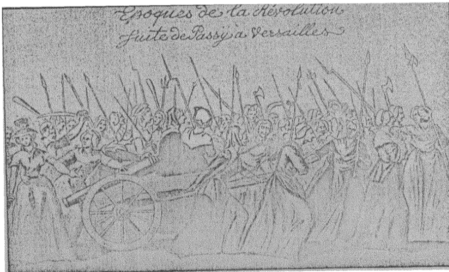
KVINNOTÅGET TILL VERSAILLES 1789. Efter en samtida teckning.

nya hundra till. Mångfaldiga tusenden voro de slutligen, som i ett oändligt tåg, under storm och regn, genom vägnarnes slam och grus, under de rika borgarnes hänleende drogo till det kungliga residenset. Så gjorde nöden folkets kvinnor till hjältinnor. Vad som icke lyckats nationalförsamlingens talare, det lyckades Paris' kvinnor. Darrande för den revolution, som maktens innehavare själva frambesvurit, undertecknade konungen de mänskliga rättigheterna. I ångest inför den folkets vilja, som yttrade sig hos dessa mödrar, hustrur och döttrar till det arbetande folket, följde kungen dem tillbaka med hela sitt hov och alla nationalförsamlingens medlemmar.