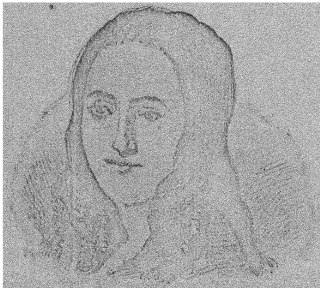
FLORA TRISTAN 1803—1844

Och varför? Ja, det veta de nog inte själva. Många stå gripna, imponerade av demon- strationstågets allvar och många överklasskvinnor ana den styrka som ändå arbetarrörelsen äger och frukta den kanske, men ännu flera stå där tanklösa och oförstående, och med känslan av det falska högmod, som håller arbetarkvinnan borta