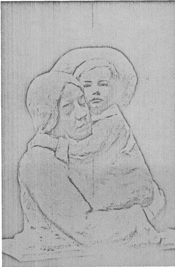
MOR OCH SON.

Plikter, sade jag, och det står jag fast vid. Ty det är den moderna, bildade husmoderns oavvisliga plikt att följa vad som sker ute i världen, det är hennes plikt att kunna resonera med sin man om dagens händelser, om de aktuella spörsmålen — annars är det minsann inte lönt att hon kommer med några krav på rösträtt! Och hur skall hon kunna följa med dagshändel-