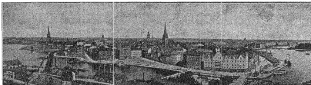
Utsikt över Stockholm från Mosebacke.

Statsministerns tal, som ju innehöll både ett löfte och ett förbehåll, är kanske att särskilt lägga märke till, ägnat som det väl var att ange de riktlinjer, den nya regeringen ämnar följa. Främst minns man då hr statsministern förklara som sin åsikt nödvändigt vara, att tillämpa en helt ny politik emot folket, nämligen tillmötesgåendets . Trodde att denna tillmötesgåendets politik var rätta vägen att vinna folkets förtroende, att genom handling visa folket att fäderneslandet var till även för dem. Men — ty det var verkligen