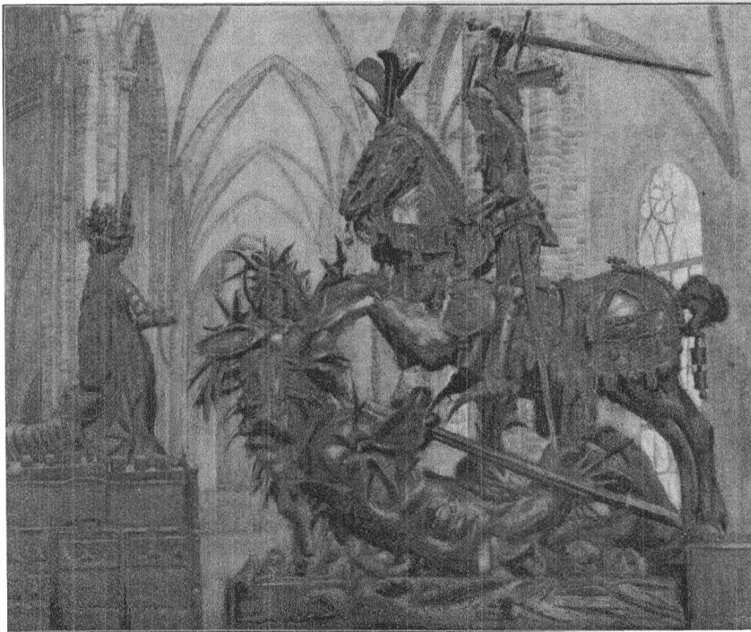
S:t Görans bild i Storkyrkan i Stockholm.

Detta förslag är en kombination av det system den tyska försäkringslagen företräder och det system, som ligger till grund för den i Nya Zeeland, Australien och England gällande ålderdomsförsäkringen; en av statsmedel utgående pension till dem, som vid