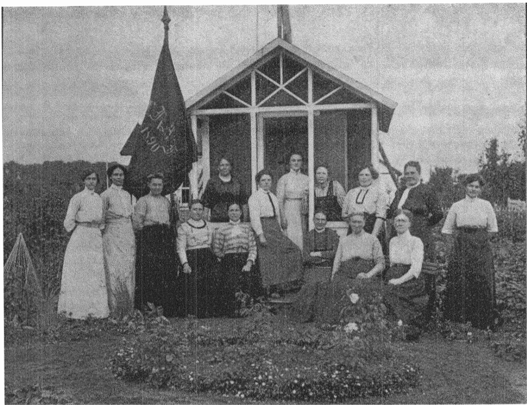
Lunds socialdemokratiska kvinnoklubb.

Morgonbris vill således vara ett verkligt agitationsmedel bland kvinnorna, ett medel till upplysning, till höjande av deras solidaritetskänsla, ansvarskänsla och målmedvetna arbete på socialismens förverkligande. Alla fackföreningar, ungdomsklubbar, nykterhetsloger, kvinnogillen och an-