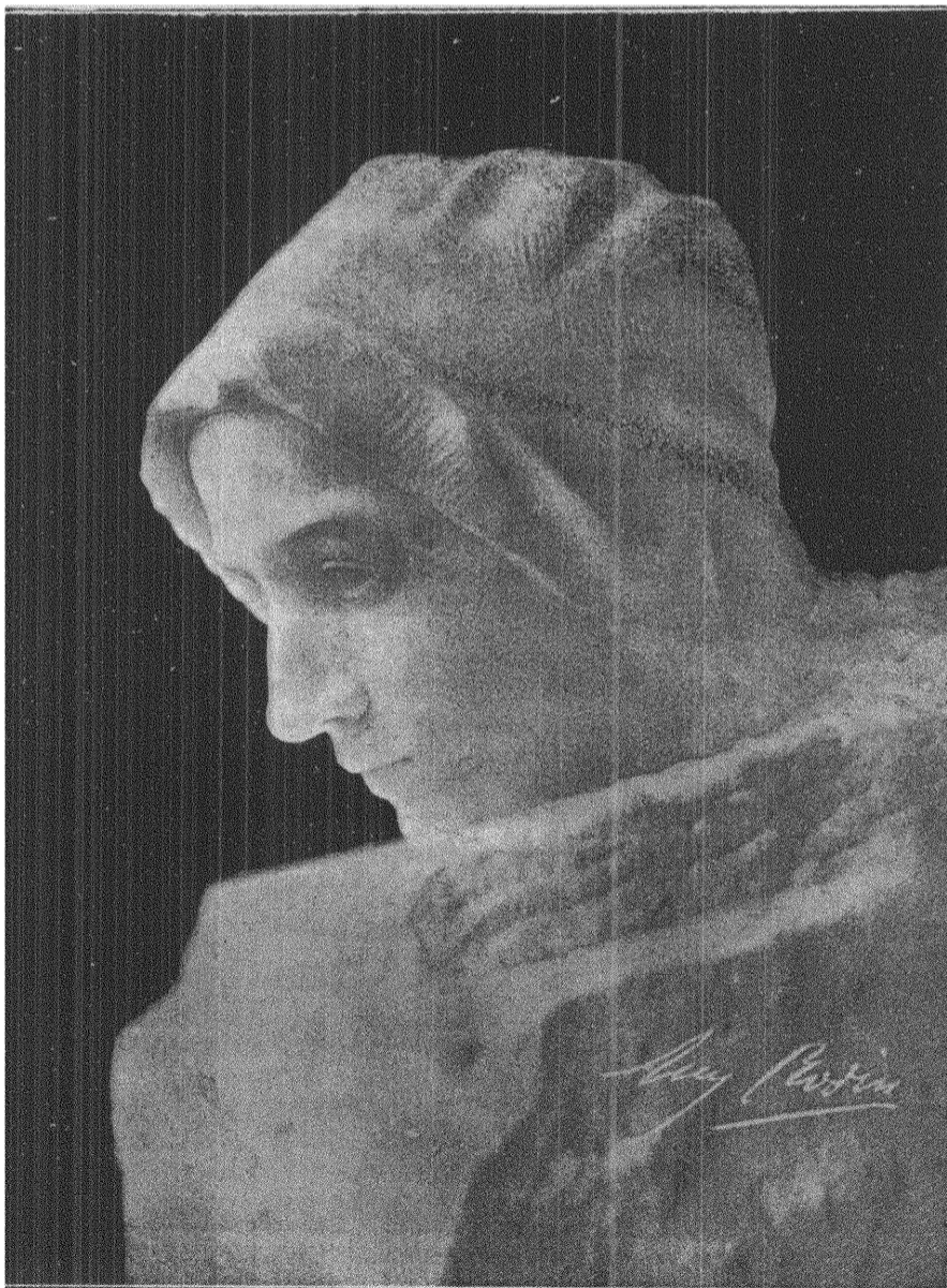
TANKEN. Skulptur av Rodin.

Det är de tusende sinom tusende proletärkvinnornas dag! Men skola de komma? Nej, måhända icke. Nöden har satt sin stämpel på dem, svälten har härjat dem i förtid; de tro, att de ingenting ha att hoppas och att vänta av