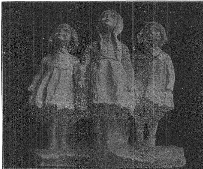
Barn, som se efter vildgässen.

tillägg för dem som under sin arbetstid haft tur att ha någorlunda goda inkomster, så att de kunnat betala inom de högre avgiftsklasserna, samt för det stora flertalet kvinnor — 125 kr. rätt och slätt.