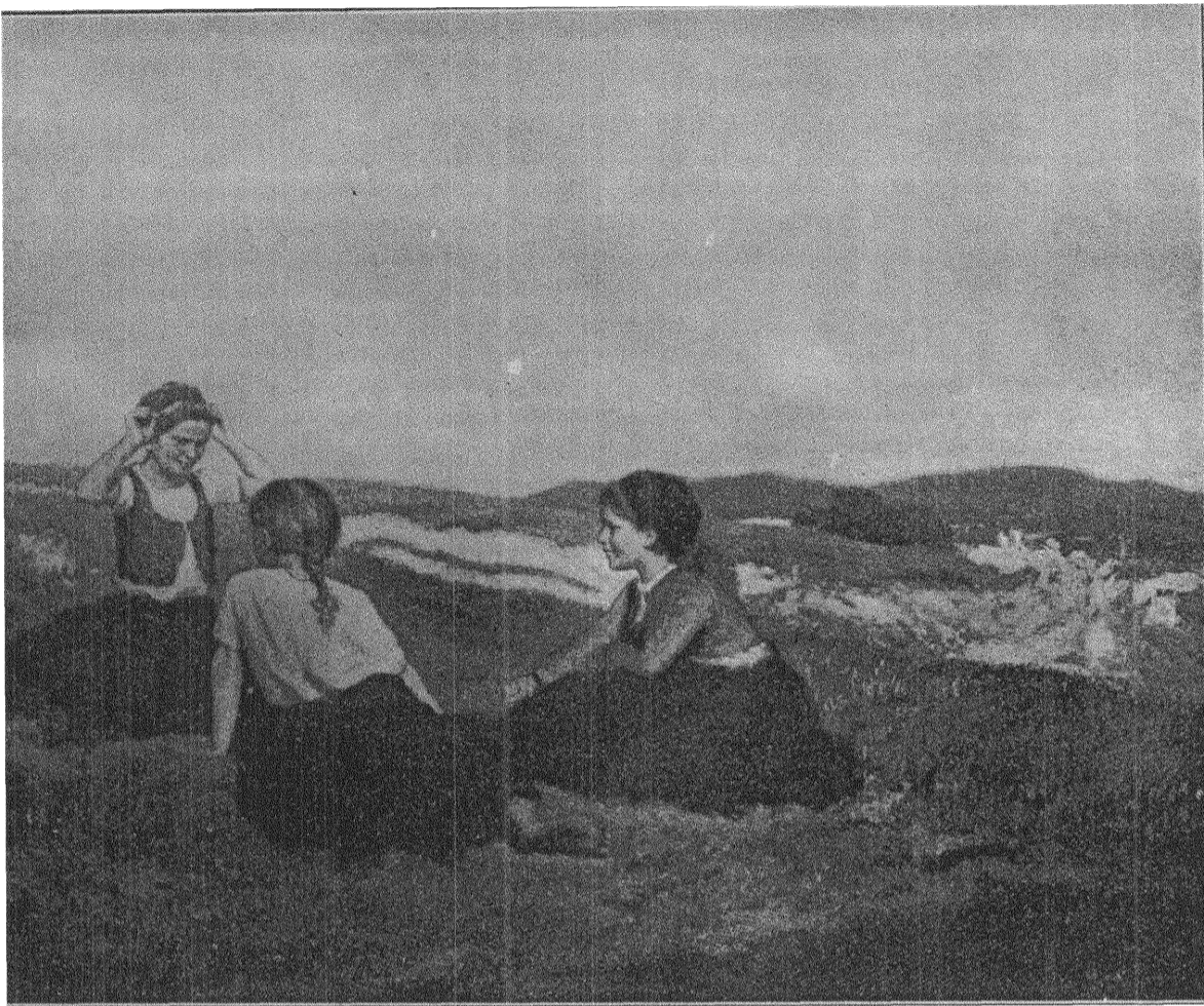
Tavla från Ungern av OSKAR GLATZ. (Ur Studio.)

Lyckan måste uppsnappas, den befin- ner sig så att säga alltid »i förbifarten». Det gäller därför hålla sig vaken för att passa ögonblicket och vinna hennes för- troende. Men vakenhet, har jag märkt, är en av de mer ovanliga konster, som människor öva, en som de fumla i mest. Så mycket i livet inbjuder till att blunda och slumra. Då slipper man se allt dess elände, då glömmar man smärtan för en stund, då hämtar man nya krafter