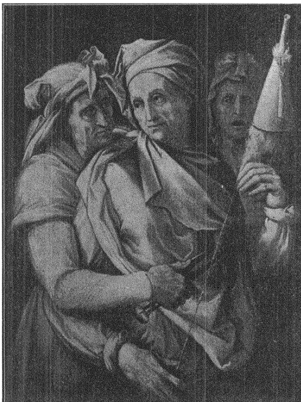
Parcerna. Målning av Michelangelo.

lysning om kooperationens betydelse för arbetsklassen såsom hjälp i kampen för bättre ekono-