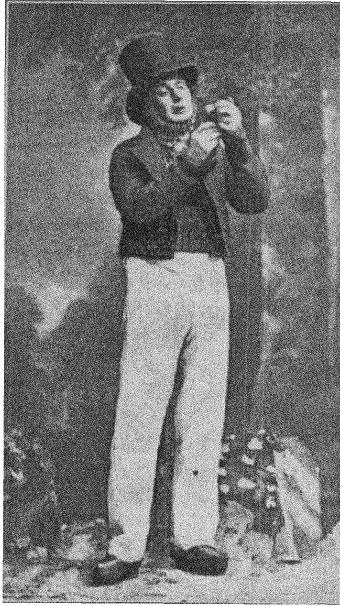
August Bondeson berättar: Far rakar sig på söndagsmorgonen.

Det är nu över 7 år sedan vi miste två om än vitt skilda så dock på samma område framstående män, nämligen den förfinade diktaren och kritikern Oscar Levertin och den ursprunglige och humoristiske allmogeskildraren August Bondeson. De båda diktarnas dödsfall inträffade på hösten 1906, Levertin av-