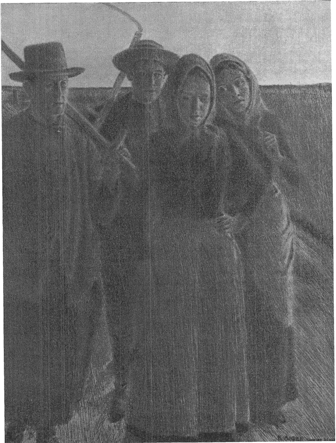
Skördefolk på hemväg. Torrnläsetsning av Knut Ander.

när hon kysste mej. Gud, den jäntan! Hon hade bröst som självsvåldigt spände hårt ut den tunna blusen. Själv var hon mjuk att lägga armen omkring och smeka, som en katta. Och hennes andedräkt — den smakade något av frisk sötmjolk, när hon låg skälvande mot bröstet intill mej. . . . Fattar du varför jag darrar lite ännu vid minnet — varför det ännu smakar något av namnlös frukt i mun på mej? Aldrig råkade jag kärligare jänta! — Omkring oss stod häggen vit, som klädda midsommarbrudar, och doftade bland björkarna. Ej långt borta, i granskogen ovanför, där landsvägen går, kvitterade en nattfågel — och inte bara en. På morgonkvisten var där en hel orkester av spelare och sångare. Från herrgården, där man ännu var uppe för ett födelsedagskalas, hördes pianospel och dämpade skraitt. På verandan satt Otto, inspektoren, som nyss giftat sej, med sin unga fru, en norsk »pige», och fortsatte smekmånaden. Genom lövverket såg jag dem. . . . Deras kroppar såg jag ibland tryckas lidelsefullt intill varandra, varpå de skrattande sprungit in. Eller jag vet inte. . . . När jag åter såg dem, sågo de upphettade ut i ansiktet — det var väl av vinet. . . . Att vara rik är nog härligt, du — att älska och älskas av en yppig, skön madonna! Min madonna, jag fat-