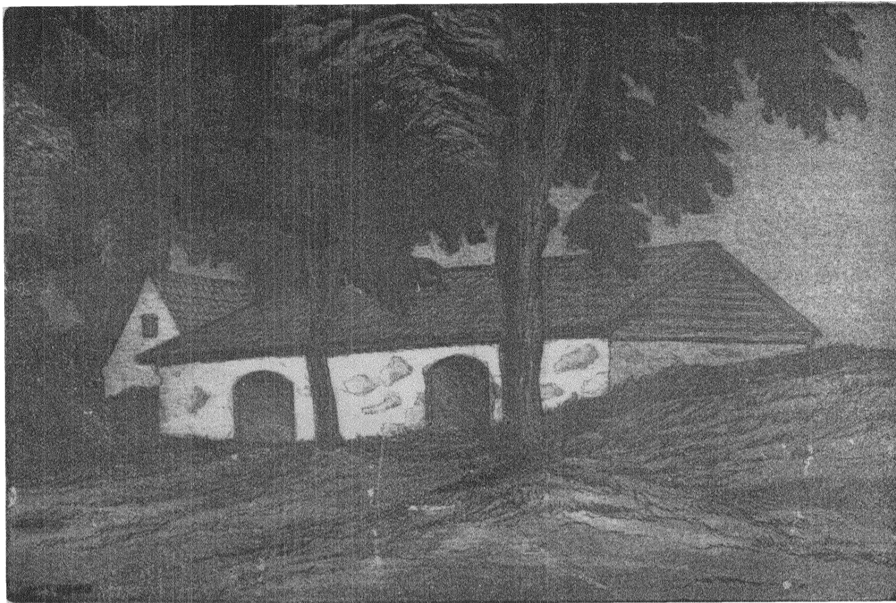
Gabriel Burmeister: Den gamla källaren.