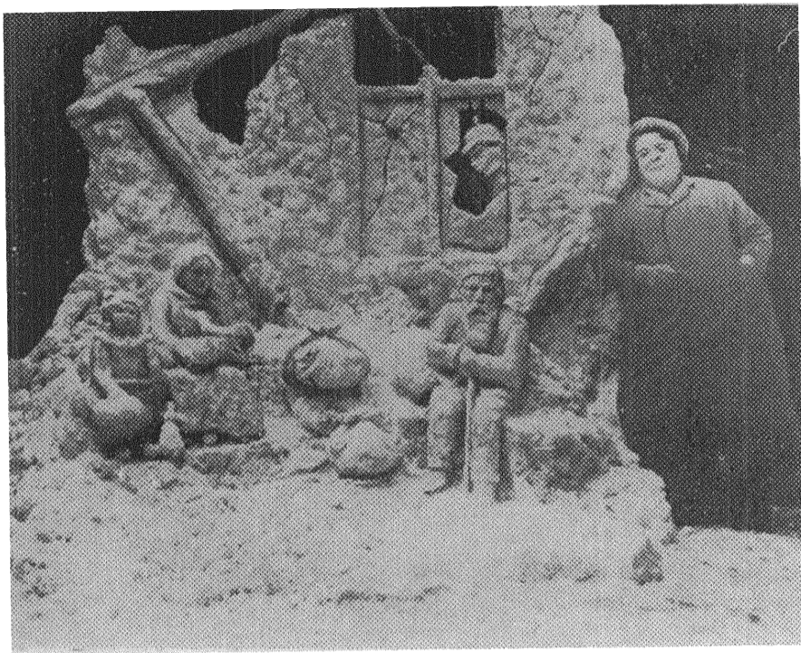
Snögrupp av fru T. TORINES.

Tysklands intressen åter ligga uti att erhålla koncession på Bagdadbanan, vilken huvudsakligen skall gå genom asiatiska Turkiet. Det hade varit meningen att åstadkomma en eko-