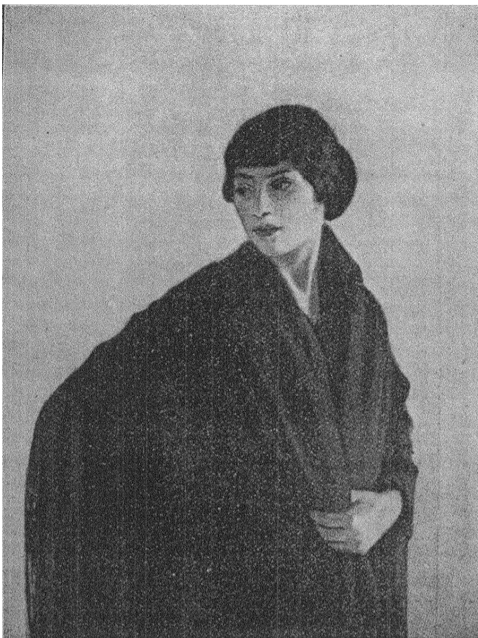
"Den svarta schalen." Oljemålning av G. F. Kelly.

Det heter så ofta, att en ordentlig arbetare kan bereda sig sin egen livslycka. Men tänk om den livslyckan skulle ligga inom ett område, dit han