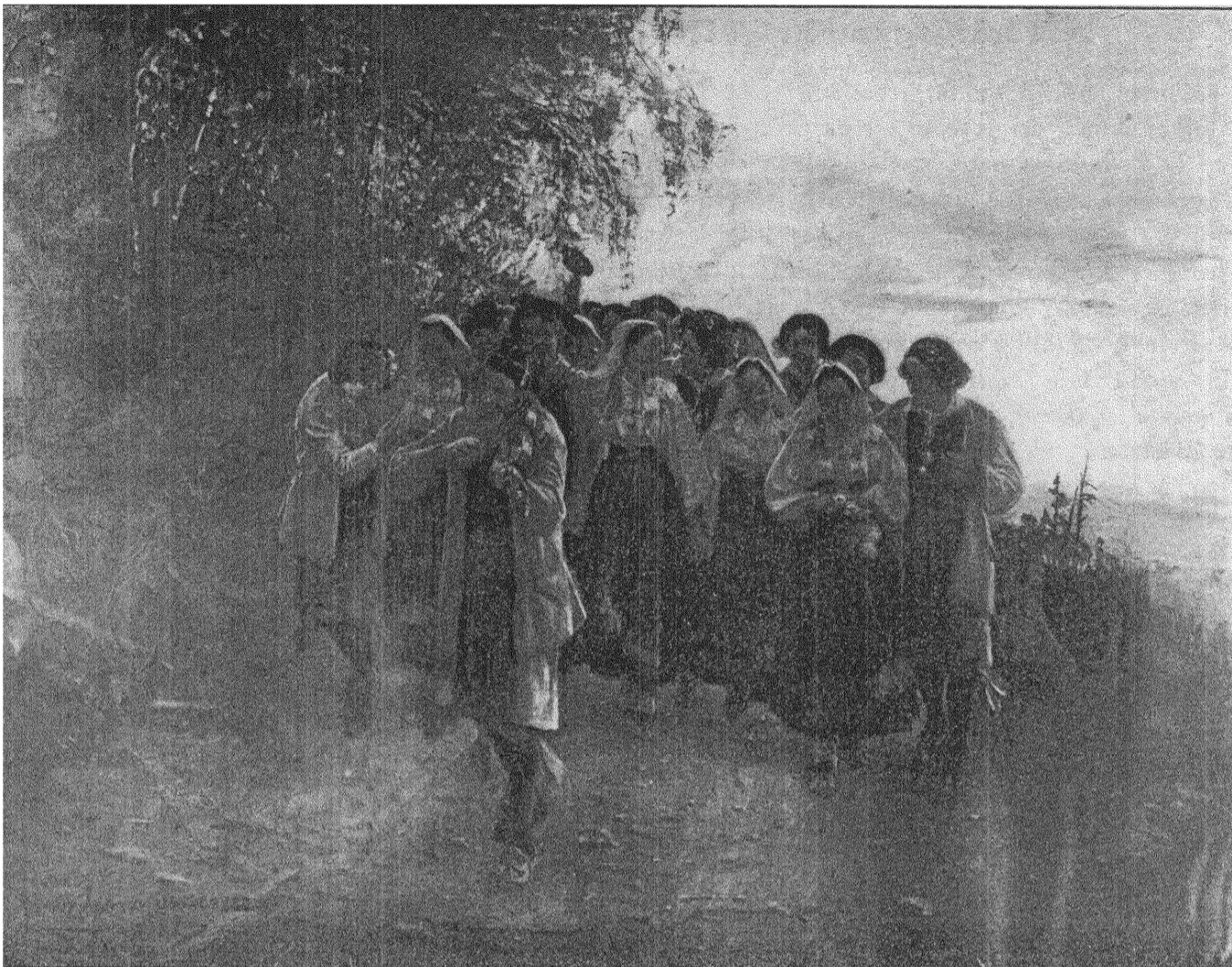
ZORN: Till dans.

styrka. Det är omöjligt att beröva människan minnet av hennes eget liv. Det är likaså omöjligt att beröva en nation minnet av dess liv. Och dock finns det länder i Europa, där man vill försöka undertrycka det nationella medvetandet.