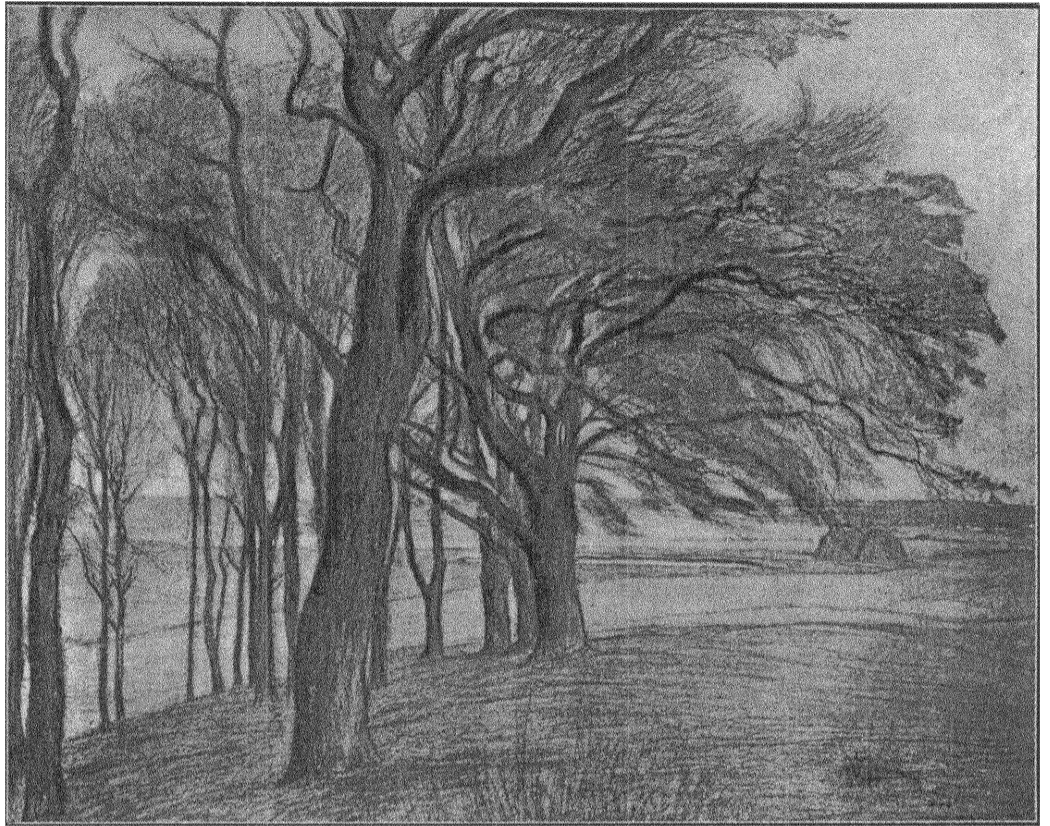
Prins Eugén: EKAR.

tragedi vi nu genomleva. Sålunda skola män och kvinnor med klarare och sannare blick se på sitt förhållande sins emellan, liksom på sina skyldigheter mot de förhärjade land och de övergivna hem, som mänskligheten ej lyckats rädda undan förstörelsen. I en värld så full av tragik måste män och kvinnor söka tröst i sanningen och de komma ej längre att kunna finna tillfredsställelse i de bekväma läror, med vilka föregående civilisationer lugnat sina tvivel.