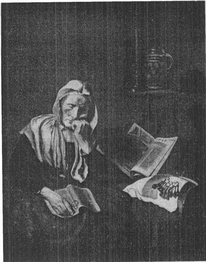
Nicolaas Maes: SOVANDE GUMMA.