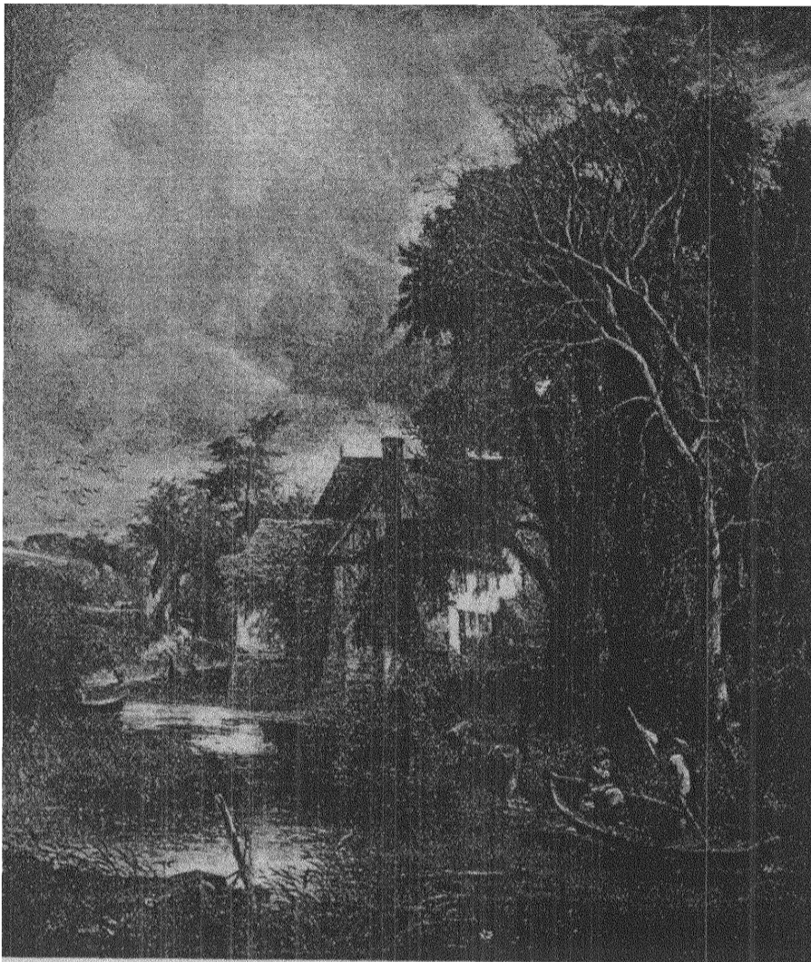
John Constable: BONDGÅRDEN I DALEN.

Hälv omedveten om vad hon företager sig söker hon sedan under nattens långa timmar ordna för hans utrustning, allt medan hon stundvis försjunker i stum och stirrande viljelöshet.