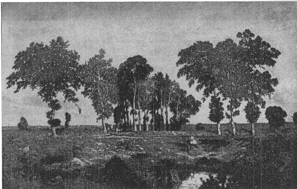
Théodore Rousseau: I SKOGBRYNET.