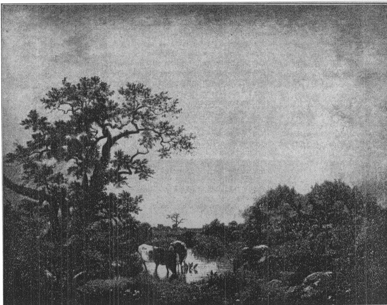
Jules Dupré: SOLNEDGÅNG.