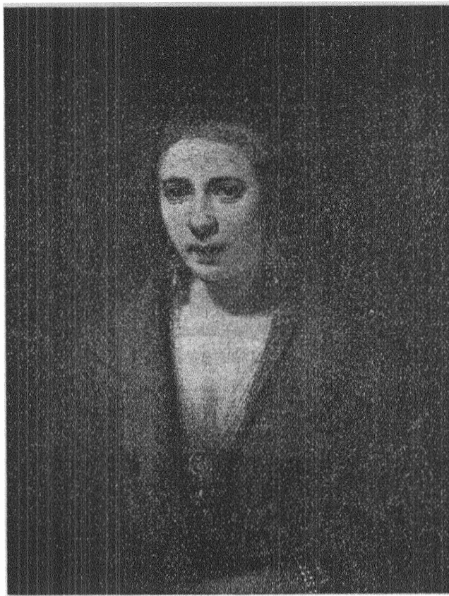
Rembrandt: HENDRIKJE STOFFELS.

Handlingsoptimismen är en sak för sig och ej så beroende av förväntningsoptimismen som man vanligen föreställer sig. Denna senare må vara