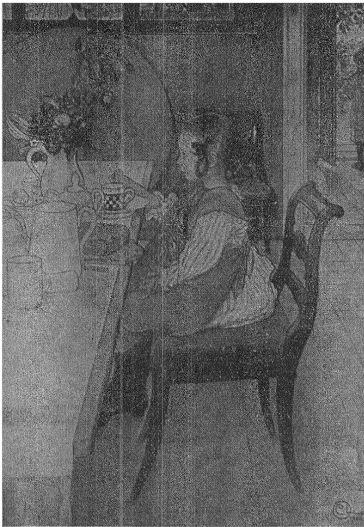
Carl Larsson: SJUSOVERSKANS FRUKÖST.