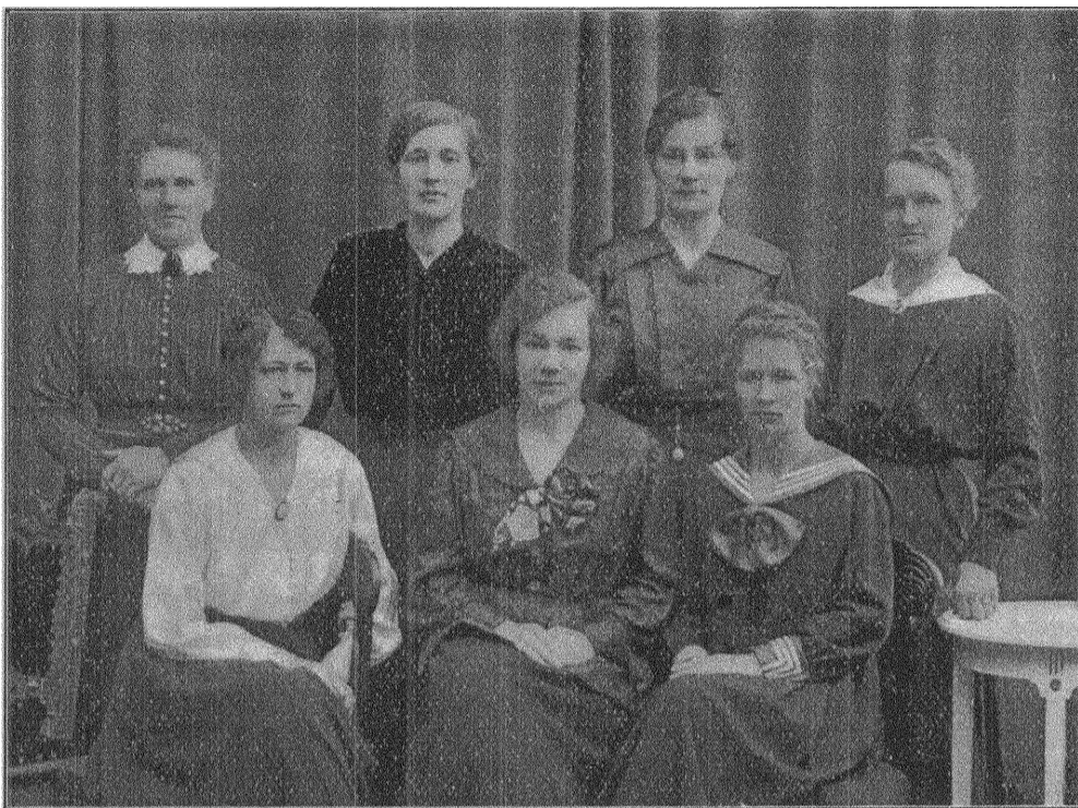
Styrelsen för Borås socialdemokratiska kvinnoförening.

Naturligtvis gick det. Ett besök blir sällan tillbakavisat. Inte ser doktorn eller sköterskorna gärna, att någon av patienterna ryckes upp ur sina filter, sedan de kommit i ro, men de se ännu mera ogärna, att något glädjeämne undanhålles dem. Och besök är nu en gång ett av de mest verk samma elixiren i sanatoriets ibland litet tröga luft. — — — Vi ha gjort vår rond genom de sex olika avdelningarna och det känns riktigt skönt att kunna sjunka till ro en stund i ett av de hemtrevliga hörnen i första avdelningens dagrum. Från den ovana kölden i sovrummen känns det naturligtvis ljuvligt för den besökande att komma in i vanlig rumstemperatur. Allt härinne är också hållet i varm och på samma gång diskret färgton. De långa, mjuka hörnsofforna, som visst närmast likna stoppade, vägghasta bänkar, tyckas inbjuda till endast förtroliga samtal. Det tämligen stora, ovala bordet mitt på golvet, bokhyllan, de bekväma stolarna, allt verkar så välgränd efter det intryck