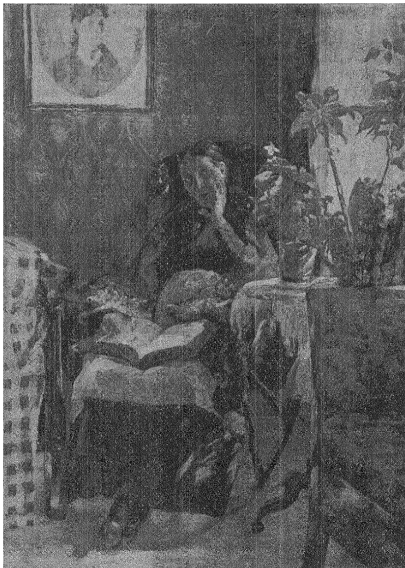
Herman Norrman: MORS PORTRÄTT.

Om dessa barn för tidigt kommo ut i allt för tungt och enformigt arbete, bleve deras och deras länders framtidsutsikter ännu mörkare. Å andra sidan krävde den skriande nöden i världen, att så många armar som möjligt kommo till användning i nyttigt arbete. Man såg som i ett blixtljus hur mänsklighetens ömtåligaste rotträd utsatts för kanske obotliga skador genom de sista årens meningslösa förödelse. Och dock bragtes man att åter hoppas genom den idealism angående fritidens användning för såväl barn som vuxna till vinnande av högre bildning och fördjupad kultur, vilken klingade igenom många anföranden i synnerhet från de polska och tjeckoslovakiska delegationerna och även från belgiskorna, bland vilka särskilt den lilla späda Mademoiselle Cappe med sin bräckliga uppsyn och sina stora strålände blå ögon föreföll att hålla sig uppe endast genom en hänförd tro på sitt lands förmåga att trots allt uppstå igen till en lycklig framtid. Tanken på de ge-