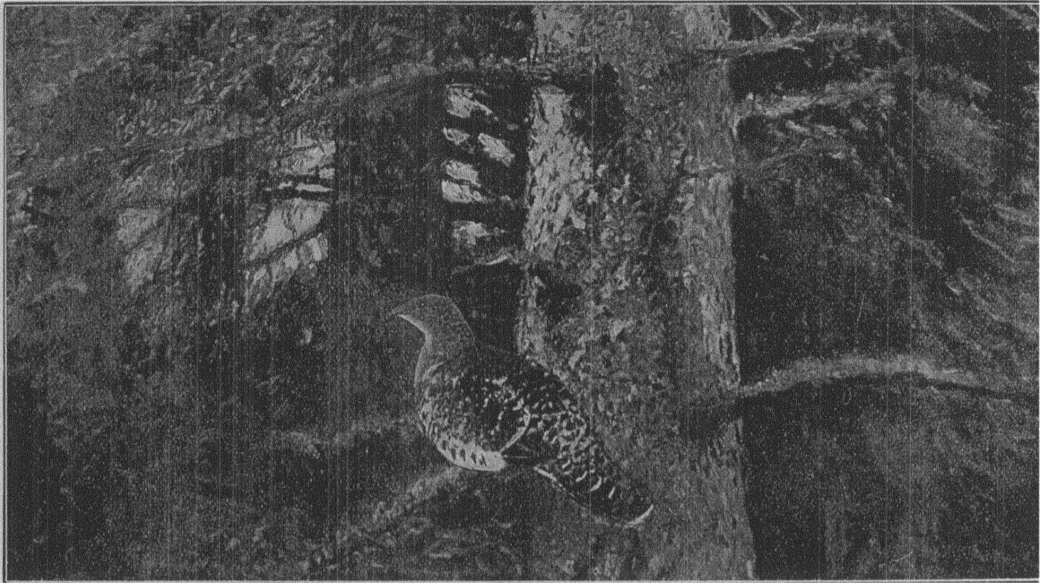
Bruno Liljefors: TJADER PÅ GREN.

lan har måst ge vika för allmän, lika rösträtt för män och kvinnor.