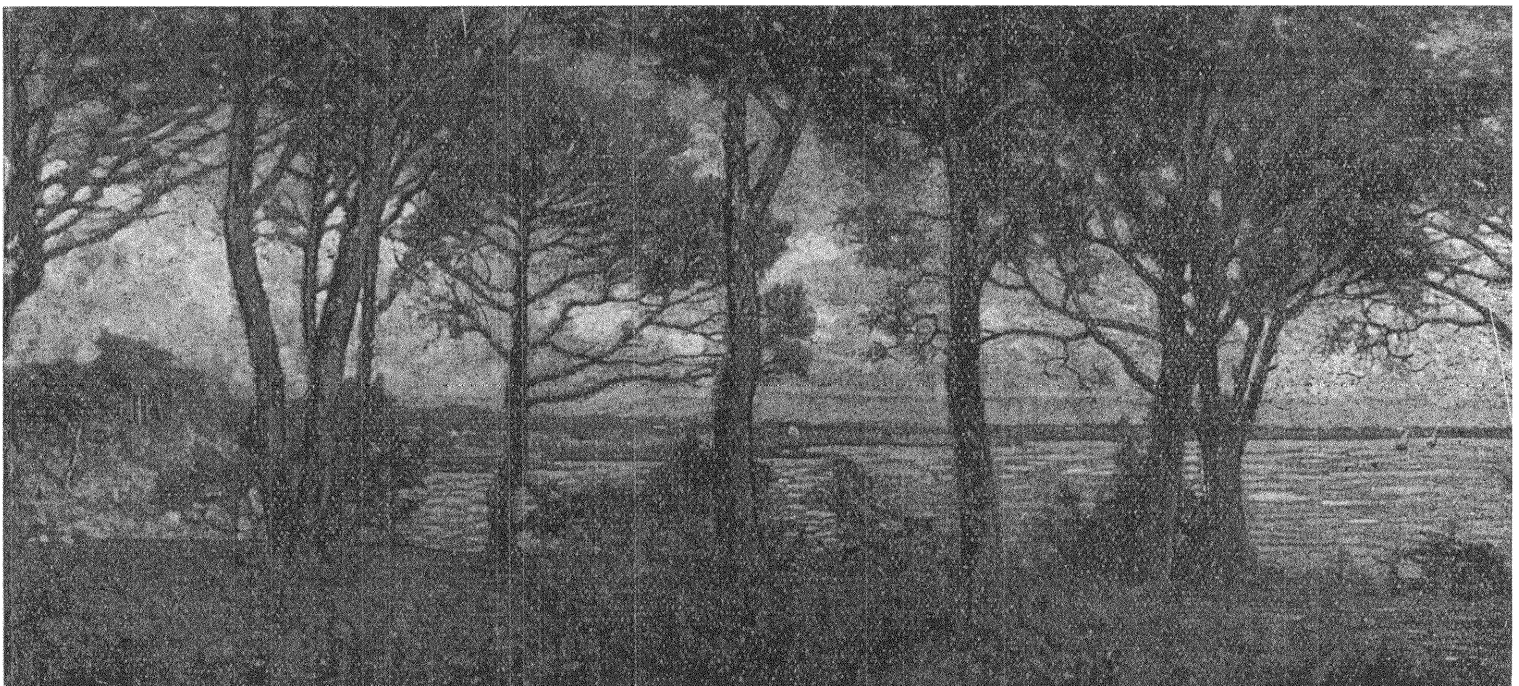
Gjoli: TIGREUSKA KUSTEN.

Statstanken som sådant, väckt till liv för mångtusende år sedan, har ännu ej "kommit till klarhet". Dess problem har ställts upp bland alla folk, och man har efter olika förmåga sökt en lösning. efter för tidens och utvecklingens påfrestningar. Det ligger i sakens natur att statstankeproblemet ej kan slutgiltigt lösas förrän och i den mån människan själv kommit till klarhet. den blom och frukt först genom inbillningskraftens och tankens högre ligande livsprocesser. Det är med statskonsten som med all annan konst. Den fullföljer inbillningskraftens växlande