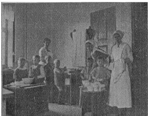
Barnen läras att hjälpa mor.

må så många skolor som möjligt medtaga ämnet.