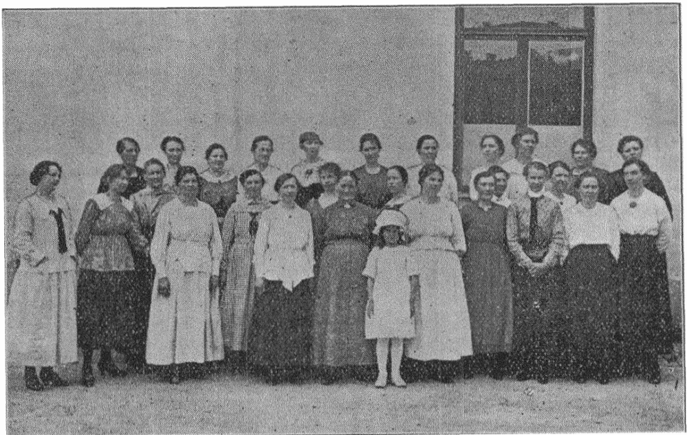
Medelpads soc.-dem. kvinnokonferens.

Konferensen öppnades av distriktets ordf., fru Vestberg, som med några ord