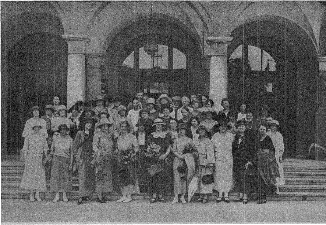
Delegerade vid kongressen.

Ett virrvarr av språk, en atmosfär av intellektuell kvinnlig kraft, ett kaos av stora frågor, vilka vänta på att bli lösta, se där första intrycket av Internationella Kvinnliga Arbetareförbundets kongress. Denna representativa samling av kvinnor från nästan alla länder, vilken samlad styrka bör det icke vara i denna kvinnörelse är vår nästa reflexion.