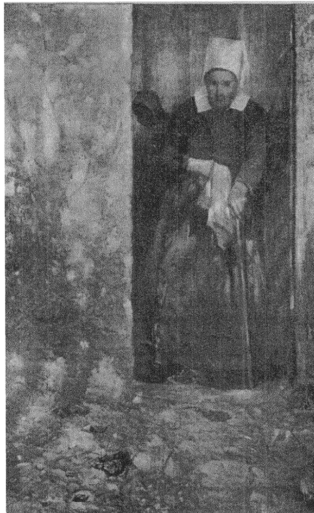
ERNST JOSEPHSON: Höstsol.