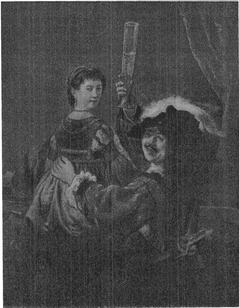
REMBRANDT: Konstnären och hans hustru.