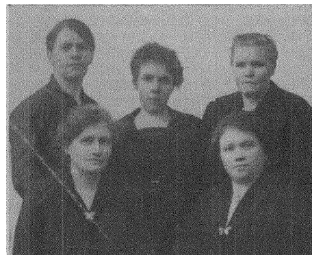
Hälsingborgs kvinnoklubbs styrelse.