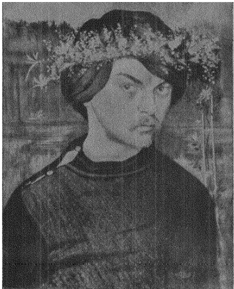
Arosenius: SJÄLVPORTRÄTT MED EN BLOMSTERKRANS.

lig. "Hus och hems" mindre lägenheter om 1 och 2 rum och kök samt 1 enkelrum äro både vackra och praktiska. På dessa inredningar är nedlagt ett värdefullt arbete för att på det lilla