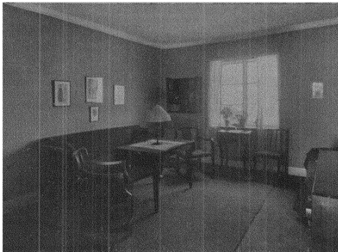
Rumsinteriör: en lägenhet på ett rum och kök.