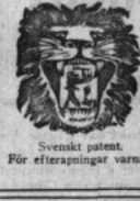
Svenskt patent. För efterpingar varnas.

I övrigt förtjill jag med storsta tänkbara högaktning din ädmönke tjänare Mr Hjulianus från U. S. A.