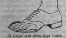
Så lätta skall denna färg i skön.

Präparat och Färgar samt linne framställning av lenare och smalar 119, med färg bläckar vilt test, alla bläckar, artstapelar av, Sv. Kex, Centr. Färg, för Färg Kultur och tillverksade i Götta Skofabrik Akt.-Det. färgs och kan beställas i Anna Ahlströms MANUFABRIK & KORTVÄRFFABRIK Göttastr. 9 - Stockholm - Tel. 581 21 88