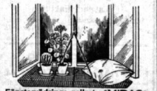
Fönstervårdnings-gallret "MIDAS" (Patentbesiktat Svenskt fabrikat av rostfritt material) Ömtyckt Nybrett

Det framhålls också, att även om den nuvarande situationen starkare än någonsin framhåver orimligheten av en statskyrka i ett land,