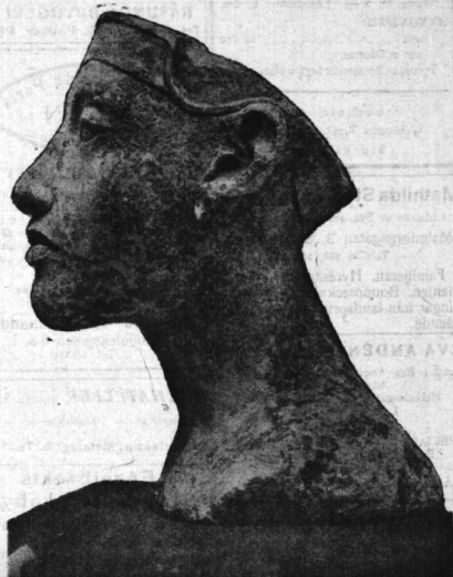
många andra egyptologers utläggningar, men den ryske diktern Mereskovski lär väl vara den förste

däremot en hum om Tutanchamon sedan upptäckten av hans grav år 1922. Han var Achnatons svårson en av dem som hjälptes åt att efter hans död söka utplåna hans farliga lära, hans minne och hans namn. Han gav anledning till ett övergående egyptiskt mod på klänningstyper, vilket kan vara tillräckligt. Upptäckten av Achnaton borde komma att betyda mera. Så har åtminstone några av de män känt det, vilka ur de återfunna urkunderna återställt hans historia och dragit fram bilder ur ljuset som återge hans anletsdrag. Tidevarvets läsare känna kanske till en bok om Achnaton av A. Weigall, överinspektör över Egyptens fornlämningar. Den utkom för fem år sen i svensk översättning och visar författarens gripenhet inför den märkliga religionsstiftaren och hans öde. Samtidigt skakar han bekrymrad på huvudet över de farliga konsekvenserna av faraos ovetliga pacifism. Achnaton har varit föremål för