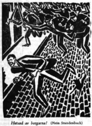
Hetsad av borgarna! (Mein Stundenbuch)