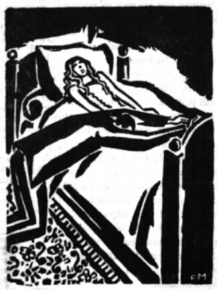
Fläckans död. (Mein Stundenbuch)

Den flamländska träsnidaren och tecknaren Frans Masereel är vid det här laget en av de markantaste figu- rerna inom den europeiska konst- närsgeneration, för vilken kriget blev en vändpunkt i andligt och konstnärligt avseende. »Han var en ikligtvis, sinnlig talang, där han satt och tecknade på belgiska krogar», skriver Thomas Mann i föreläsa till ett av hans verk. »Kriget har gjort honori till en andlig gestalt, ett org- an för det offentliga samvetet». Själv säger Masereel: »Jag var före