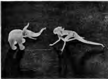
Leksaker av glas.

gårna särskilt för barnen. Så även i TjECKOSLOVAKIET. De kvinnliga fackskolornas utställning av barn- kläder är mycket förmålig. Små lätta, läckra plagg, på vilka man lagt ner mycket omsorg och om- tanke. Kanske till och med litet för mycket. För hur ska ungdomarna leka i sådana »skapelser»?