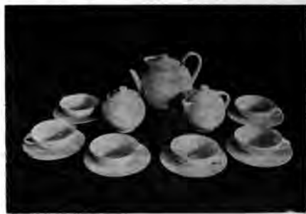
Tervis i gull porlän.

vända sådana glasur till? Vanliga fönsterrutor är absolut både vackrare och mera praktiska.