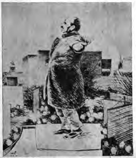
LIEBKNECHT TALAR. Efter teckning av Mogens Lorentzen.

En stor samling helgonbilder av olika ålder ger ett ypperligt uttryck åt den folkliga uppfattningen. »Den sörjande Kristus» är återgå till ett hedniskt motiv (landet kristnades först i början av 1400-talet), och skall symbolisera folkets sorger och