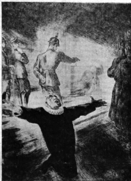
EDITH CAVELLS DOD. Efter etsning av J. F. Willumsen.

att se en hel del ungdom, interna- tionella studenter i Genève.