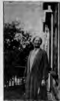
Doktor Karolina Widerström.

ligt slöseri, säger hon och berättar om de olika arbetsskeden, som blomsterhyllningarna representerar. Där är t. ex. en hälsning från en av de gamla kamraterna på anatomiskaalen för femtio år sedan, när doktor Widerström som ung studentska började sin bana, den första kvinnliga medicinaren i Sverige — och så vidare genom alla år ända fram till den unga och livskraftiga sammanfattning av kvinnliga läkare i Sverige, Kvinnliga läkares klubb, som med en praktfull skär kamelia — varmt uppskattad av födelsedagsbarnet — hyllat den avhållna kollegan och banbryterskan.