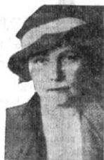
Fru Alva Myrdal.