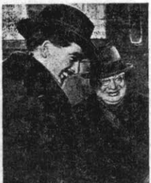
Mr Eden tar avsked av Litvinov på bankgården i Moskva.

ALLMAN PESSIMISM råder nu inför Stresakonferensen, dit de tre regeringscheferna Mussolini, MacDonald och