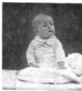
Det omdiskuterade barnet.

— Jag vill gärna ha barn, det vill jag visst. Men jag blir mörkrad, när jag tänker på läget i världen. Bara man öppnar en tidning kan man bli förskräckt. Och nog känns det förfärligt ansvarfullt att föda barn till en sådan värld.