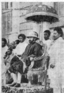
Kejsar Haile Selassie av Abessinien.

I DANMARK HAR ETT BONDETÄG med 30,000 deltagare på initiativ av den nazistiskt färgade lantbrukarorganisationen L. S. uppväkt konungen och statsministern för att genomdriva sina krav på statligt säkerställda produktionspriser, avsättningsförhållanden m. m. Konung Christian mottog fåget synbart rörd men höll bestämt på de konstitution-