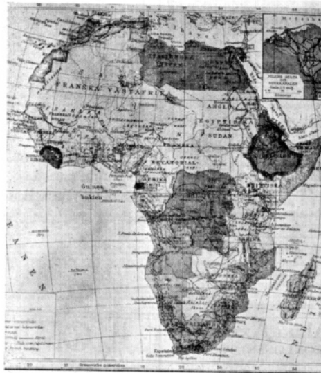
De svarta områdena, Abessinien och Liberia, äro de enda oberoende länderna av hela afrikanska kontinenten.

Den politiska kartan över Afrika visar bilden av en av främmande makter helt beroende världsdell. Av hela det väldiga området på 29 miljoner kvadratkilometer är det bara två små fläckar som göra skäl för namnet oberoende länder , nämligen det omstridda Abessinien i öster och den lilla negerrepubliken Liberia på västra kusten. Utom en del av Saharaöknen, som praktiskt taget saknar ägare, står för övrigt hela den afrikanska kontinenten i form av kolonier, skyddsområden eller mandatländer under olika europeiska makters kommando. Icke mindre än 53 miljoner av Afrikas invånare lyda sålunda under Storbritannien. Därtill kommer Egypten med sina 10 miljoner, som ehuru till namnet självständigt faktiskt lyder under England. Frankrike råder över 35½ miljoner människor, Portugal över nära 9 miljoner, Italien över knappt 2, Spanien över 1½ och Belgien över 11 miljoner.