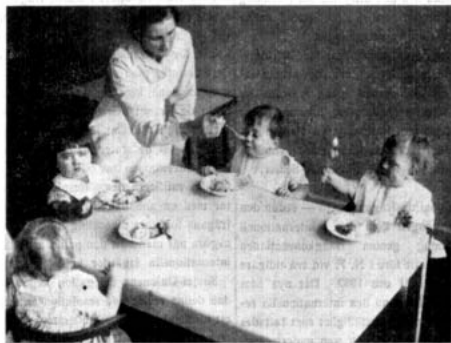
Frakost i Stiftelsen Fredrik Eens minne.

ställes i ordning till julen o. s. v. På en vägg i småbarnsskolan hängde ett stort ark glanspapper, och barnen hjälptes åt att göra ett landskap genom att av glanspapper i olika färger klippa ut och sätta upp svampar, träd, buskar, stugor och människor. Vid sådana gemensamma arbeten kan de skickligare forma de svåra föremålen och de mindre skickliga små enkla saker, alldeles som i ett stort samhällsliv. Ingen kan känna sig förbisedd, ty alla behövs för att båda den