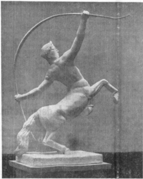
Kentaurer. Den ursprungliga modellen i brons.