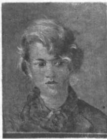
André Derain: Ung flicka.

En utställning av vad den moderna franska konsten har som bäst är alltid ett evenemang; gäller det en så förnämlig konstnär som André Derain blir det en upplevelse. På svensk-franska konstgalleriet utställs för närvarande en samling på ett tretio-tal verk från de sista årens produktion, på ett par undantag när, varav en del ej förut visats offentligt ens i Paris. Deras premiär här i Stockholm kan tagas som ett tecken på de intima förbindelserna mellan svenskt och franskt konstliv, och med tacksamhet kan man åter annotera den roll svensk-franska konstgalleriet spelat därvidlag.