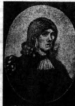
Urban Hjärne 1641-1724 (själporträtt).

För den fria vårdens möjliggörande föreslås att staten övertager en betydan-