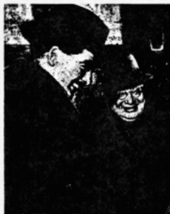
Maksim Litvinov (t. h.).

Litvinov framhöll däri att Sovjet-Unionens regering alltid ansett total avrustning som den säkraste fredsgarantin. När nu emellertid en sådan radikal åtgärd icke lätt sig genomföra, återstår intet annat än att söka göra Nationernas Förbund till ett effektivt fredsstrament. Att stärka N. F. — det innebär att ställa sig solidarisk med principen om fredens odelbarhet. Nationernas förbund är nu mera än någonsin en internationell nödvändighet. Det måste leva, det måste bli starkt, starkare än någonsin förr.