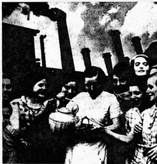
Strejkande industriarbetare vid »Chocolats Suchards» fabriker i Paris.

ett nytt krig. Nuet är fullt av paradoxer för en livsbejakande mänsklighet.