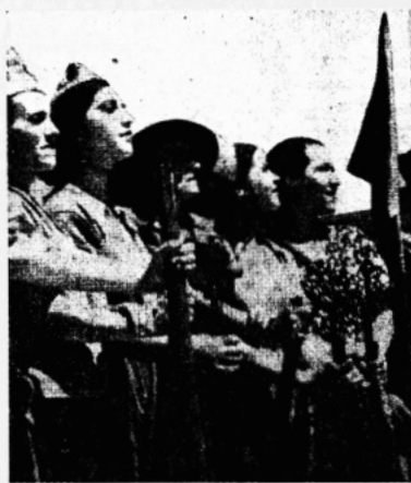
Inbördeskriget i Spanien: Beväpnade kvinnor delta i striderna.

Europa står ännu en gång redo att med liv och allt kämpa för freden genom