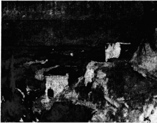
Hugo Zuhr: Från Arkipelagen.

En konsthandlande sade häromdagen med en underton av komisk sorgsenhet: Herrar kritici gillar numera bara modern konst. Yttrandet kunde ej undgå att hos en person med undertecknads syn och känsla utlösa ett litet leende. — Fullt så farligt är det emellertid inte. I den uppsjö av konst som nu råder här — verklig högsåsong, överallt fullt med publik! — ser man än så länge tillräckligt med torr naturalism, överväldigande främst genom kvantitet och detaljhantering. Habilt, skickligt salongsmåleri, med smakfullt, säkert, ibland raffinerat brijerande med färgflekter och stoffverkan.